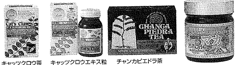
キャッツクロウ茶 キャッツクロウエキス粒 チャンカピエドラ茶 マカ粒