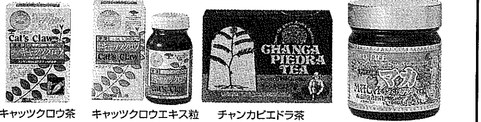
キャッツクロウ茶 キャッツクロウエキス粒 チャンカビエドラ茶