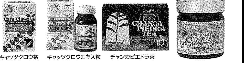
キャッツクロウ茶 キャッツクロウエキス粒 チャンカピエドラ茶 マカ粒