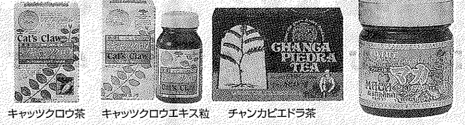
キャッツクロウ茶 キャッツクロウエキス粒 チャンカピエドラ茶 マカ粒