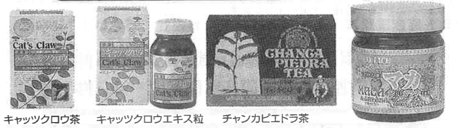
キャッツクロウ茶 キャッツクロウエキス粒 チャンカピエドラ茶